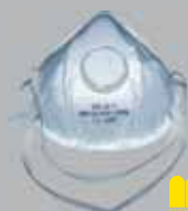
Filter Klass FFP 2