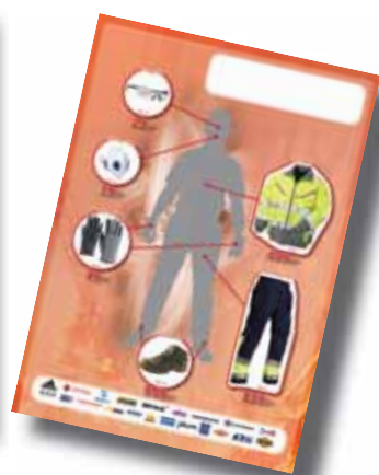
Exempel på hur några av våra tidigare DR kampanjer har sett ut.