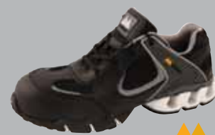
Grand Prix Skyddssko