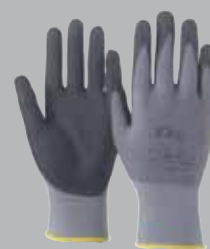
Ergo Tec Monteringshandske